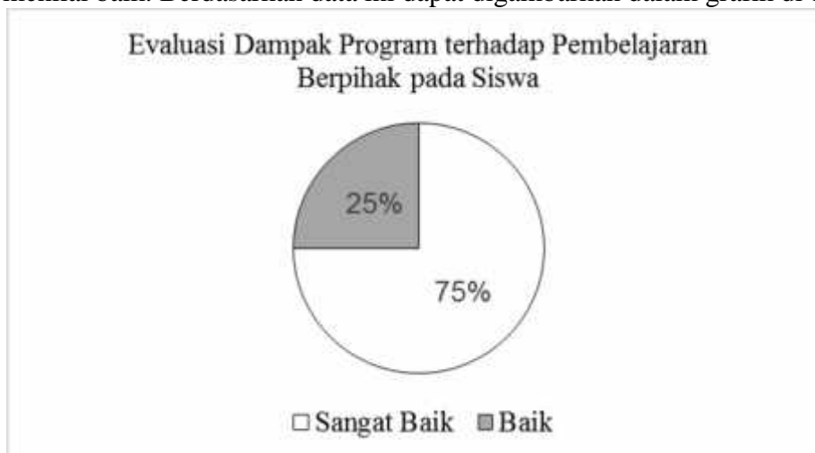
Gambar 2. Grafik Dampak Program terhadap Pembelajaran Berpihak pada Siswa

Berdasarkan kedua tabel di atas, terdapat 75% atau 6 orang responden yang menilai bahwa dampak pembelajaran pada murid adalah sangat baik. Selebihnya 25% atau 2 orang responden menilai baik. Berdasarkan data ini dapat digambarkan dalam grafik di bawah ini.