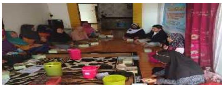
Gambar 1. Penyampaian Materi Pengabdian

Sebelum materi berlangsung, salah seorang tim memberikan pertanyaan sebagai pretest. Pretest ini dimaksudkan sebagai jejak awal pengetahuan para peserta. Hal ini sesuai dengan (Asriati et al., 2023; Syamsuri et al., 2023) yang menyatakan bahwa pretest merupakan test awal untuk mengetahui pengetahuan awal peserta. Tim pelaksana kegiatan PKM memberikan pemahaman kepada para peserta bahwa mereka adalah sumberdaya, sehingga memiliki nilai yang sangat tinggi. Hal tersebut dilakukan sebagai bentuk motivasi kepada para peserta, agar lebih giat dalam menjalankan bisnis.