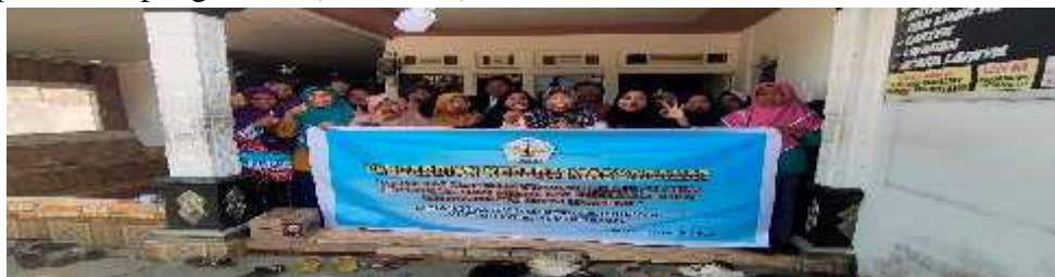
Gambar 4. Foto Bersama antara tim pelaksana dan peserta kegiatan PKM

materi yang disampaikan sangat menarik dan membantu peserta agar selalu mengudate semangat mereka dalam menjalankan bisnisnya. Selanjutnya tahapan terakhir yaitu, penutup dengan memberikan games kepada peserta, dan pemberian hadiah bagi peserta yang mampu menjawab dengan benar, dan setelah penutup tersebut, dilakukan foto bersama antara peserta dan tim pelaksana pengabdian (Gambar 4).