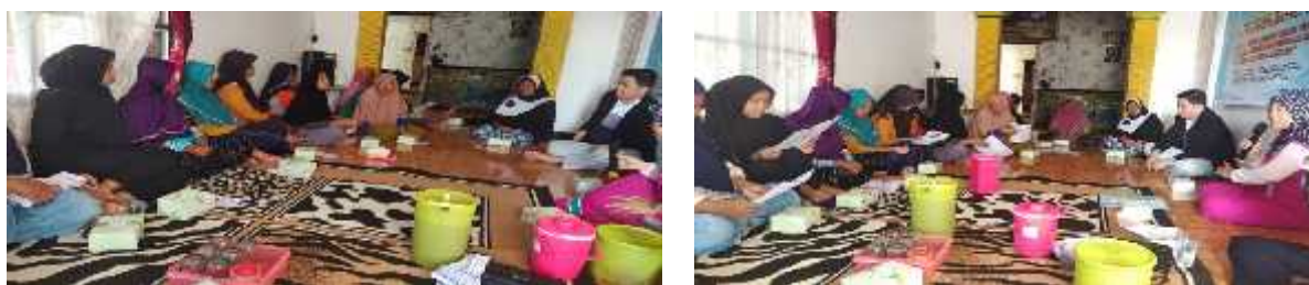
Gambar 2. Tahap Diskusi dan Post Test

Peserta mengikuti materi dengan sangat antusias, terbukti dari keaktifan para peserta. Banyak peserta yang mengajukan pertanyaan seperti terlihat pada gambar 2. Menurut peserta, karakter tiap orang berbeda, sehingga membuat mereka bingung dalam mengelola agar sumberdaya ini dapat meningkatkan bisnis. Setelah sesi diskusi, maka dilanjutkan dengan post-test dengan memberikan angket yang berisi sejumlah pertanyaan (Gambar2). Menurut (Wimpy et al., 2021), post-test adalah suatu metode yang dilakukan dengan cara memberikan sejumlah pertanyaan guna mengetahui peningkatan pemahaman peserta setelah pemberian edukasi.