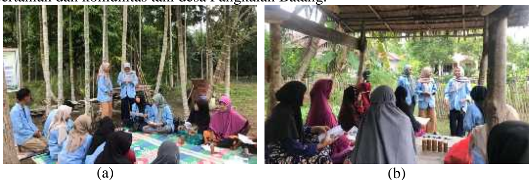
Gambar 2. Sosialisasi POC (a) Kelompok Wanita Tani (b) Dasa Wisma

Setelah dilaksanakannya pembuatan pupuk maka diadakan sosialisasi mengenai pupuk organic cair yang telah dibuat. Tim KUKERTA mengadakan sosialisasi di dua tempat yang berbeda, lokasi pertama diadakan di Kelompok Wanita Tani (KWT) manggis dan lokasi kedua diadakan di Dasa Wisma desa Pangkalan Batang. Target dari sosialisasi pupuk organic cair ini adalah masyarakat sekitar, tetapi lebih diutamakan untuk masyarakat yang memiliki lahan pertanian dan komunitas tani desa Pangkalan Batang.