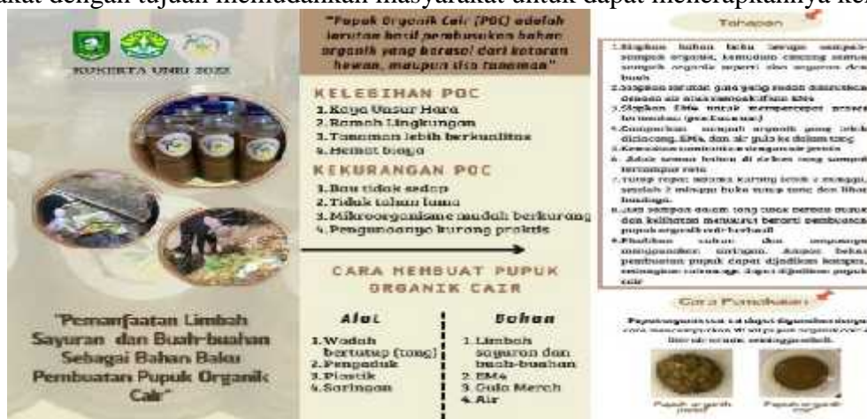
Gambar 3. Leaflet POC yang dibagikan kepada Masyarakat

Tim KUKERTA juga membuat leaflet yang berisikan kelebihan dan kekurangan pupuk organic cair, cara pembuatan pupuk organic cair, dan cara penggunaan dari pupuk organic cair. Kemudian tim KUKERTA membagikan leaflet yang telah dibuat kepada masyarakat dengan tujuan memudahkan masyarakat untuk dapat menerapkannya kembali.