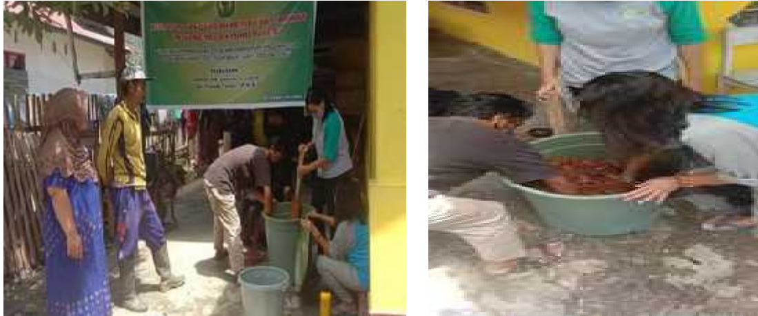
Gambar 1. Pembuatan POC Berbahan Dasar Air Kelapa dan Sabut Kelapa

Adapun POC yang berhasil dibuat saat bimbingan teknis adalah POC berbahan dasar air kelapa dan POC berbahan dasar sabut kelapa. Kedua bahan tersebut dipilih karena Desa Nggawia berada dekat dengan pinggir laut dan buah kelapa tersedia sangat banyak di desa tersebut. Hampir setiap rumah warga ditumbuhi oleh berbagai jenis pohon kelapa. Pupuk organik cair yang telah dibuat difermentasi selama 3 minggu sebelum diaplikasikan. Adapun ZPT yang dibuat adalah ZPT berbahan dasar air kelapa dan bawang merah. Pembuatan ZPT dilakukan bersamaan dengan penanaman nilam di polybag. Dalam pembuatan POC dan ZPT, dihadiri pula oleh beberapa warga, baik yang diundang maupun yang datang atas kemauan sendiri.