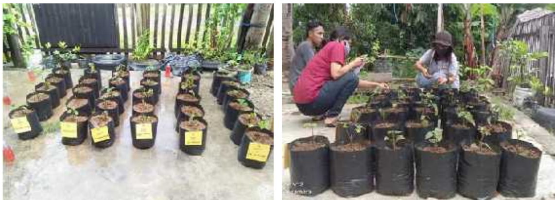
Gambar 2. Penanaman dan Pengamatan Setek Nilam

Aplikasi POC dilakukan setelah 3 minggu sejak waktu pembuatannya. Hal ini bertujuan untuk memberi waktu bagi POC agar terfermentasi secara sempurna. Pupuk organik cair yang telah difermentasi sedikit berbau alkohol dan tidak berbau busuk maupun berulat. Pupuk organik cair dari sabut kelapa berwarna lebih pekat dibandingkan pupuk organik cair berbahan dasar air kelapa. Pupuk organik cair dan ZPT diaplikasikan pada tanaman nilam yang ditanam pada polybag. Beberapa pucuk nilam diambil dari kebun warga, kemudian ditanam pada polybag dengan media tanam berupa tanah. Sebelum ditanam, setek nilam direndam dalam ZPT bawang merah dan air kelapa selama kurang lebih 5 jam. Setelah direndam, setek nilam ditanam pada media yang telah disiapkan (Gambar 2).