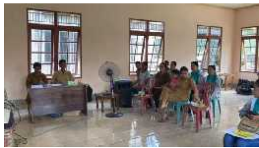
Gambar 2. Kegiatan sosialisasi PKM

Desa Simpang Kasturi memiliki empat dusun yaitu Dusun Delan, Dusun Bobor, Buranti, Dusun Simpang Kasturi dan Dusun Singkong Luar dengan total wilayah seluas 2.800 Ha. Dusun Bobor Buranti masih memiliki hutan yang cukup luas dibandingkan dusun-dusun lainnya. Beberapa HHBK di Dusun Bobor seperti bambu, madu, tengkawang dan tumbuhan obat yang perlu untuk lebih dikembangkan pengelolaannya. Berdasarkan hasil diskusi, terdapat beberapa kendala yang dihadapi oleh para peserta yaitu keterbatasan informasi khususnya aturan pengelolaan HHBK dan belum adanya inventarisasi komoditas HHBK di wilayah Kabupaten Landak sehingga lembaga-lembaga di desa belum memiliki pemahaman mengenai HHBK. Hal serupa juga dihadapi di beberapa wilayah di Indonesia seperti pada masyarakat di perbatasan Papua Indonesia- Papua New Guinea (Muttuqin et al , 2021).