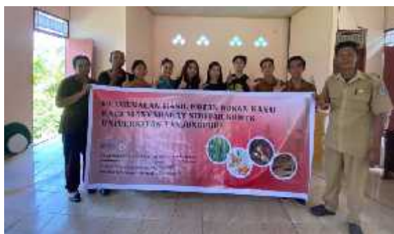
Gambar 1. Tim PKM bersama perangkat desa dan peserta

Kegiatan sosialisasi dilanjutkan dengan penyuluhan, sharing pengalaman dan diskusi tentang potensi HHBK di Desa Simpang Kasturi, pemanfaatannya serta bentuk pengelolaan hutan oleh masyarakat Desa Simpang Kasturi. Peserta sangat memanfaatkan sesi sharing pengalaman dan diskusi ini dengan menyampaikan pengalaman dan permasalahan terkait pemanfaatan dan pengelolaan HHBK di masing-masing dusun di Desa Simpang Kasturi (Gambar 2).