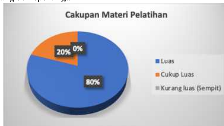
Gambar 7. Respon Peserta atas Cakupan Materi Pelatihan

Gambar 6 menunjukkan bahwa materi pelatihan yang diberikan kepada peserta relevan dengan kebutuhan yang dihadapi dalam salah satu aspek manajemen masjid yaitu pengelolaan keuangan. Semua peserta (100%) menyatakan bahwa materi pelatihan literasi pengelolaan keuangan masjid yang disajikan relevan dengan kebutuhan takmir masjid. Hal ini menunjukkan bahwa takmir masjid sebagai pihak yang bertanggung jawab atas pengelolaan keuangan masjid memiliki keinginan yang kuat untuk menyusun dan menyajikan laporan keuangan masjid sesuai standar akuntansi sebagaimana diatur dalam ISAK 35 dalam rangka menciptakan transparansi dan akuntabilitas pengelolaan keuangan masjid kepada berbagai pihak yang berkepentingan.