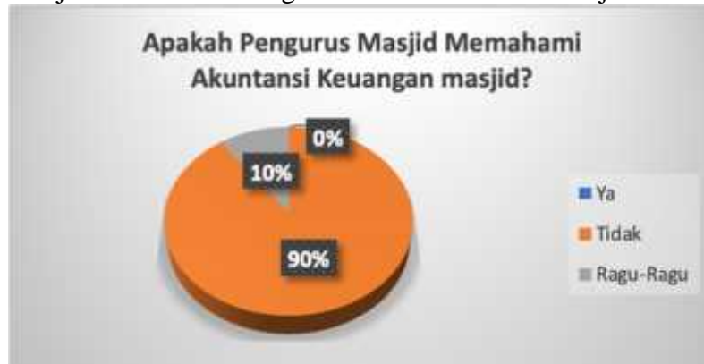
Gambar 2. Pemahaman Pengurus Masjid tentang Akuntansi Masjid

Gambar 1 menunjukkan bahwa setiap masjid yang diteliti (100%) memberikan laporan keuangan masjid kepada jemaah Jumat hanya dalam bentuk pendapatan dan pengeluaran tunai. Belum ada satu pun pengurus masjid yang menghasilkan laporan keuangan dengan menggunakan standar akuntansi. Terlihat pada Gambar 2, hal ini terjadi akibat pengurus masjid di Takmir kurang memahami akuntansi masjid.