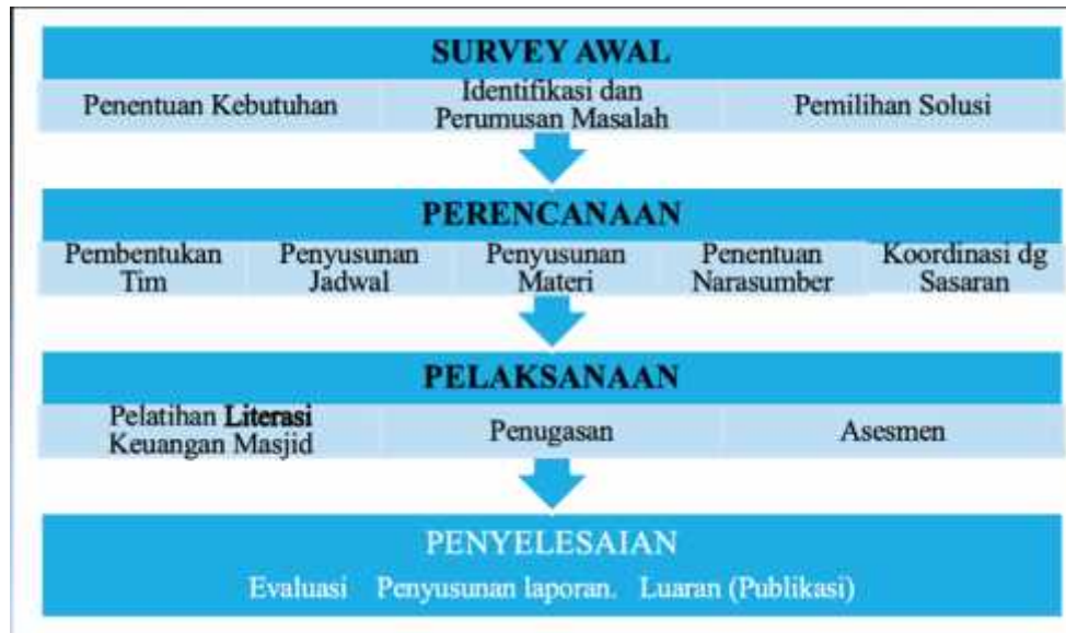
Gambar 3 Kerangka Pemikiran Kegiatan

Instrumen evaluasi kegiatan pengabdian ini menggunakan pre-test dan post-test . Kegiatan pre-test bertujuan untuk mengetahui tingkat pengetahuan dan pemahaman peserta terkait dengan literasi keuangan masjid dan ISAK 35. Kegiatan pelatihan diberikan secara teori dan penugasan guna memberikan literasi kepada peserta agar memiliki pengetahuan dan pemahaman yang memadai terkait dengan pengelolaan keuangan masjid berbasis ISAK 35. Materi pelatihan guna meningkatkan literasi pengelolaan keuangan masjid terdiri atas: penyusunan rencana kegiatan dan penganggarnya, penyusunan laporan keuangan masjid berbasis ISAK 35, dan praktik penyusunan laporan keuangan masjid. Adapun Post Test merupakan evaluasi dan asesmen yang dilaksanakan secara tertulis. Tujuan post test ini untuk mengetahui tingkat pengetahuan dan pemahaman peserta setelah mengikuti rangkaian kegiatan pelatihan untuk meningkatkan literasi pengelolaan keuangan masjid.