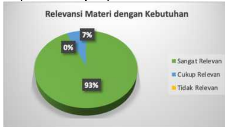
Gambar 6. Respon Peserta atas Relevansi Materi dengan Kebutuhan Peserta

Capaian pelaksanaan kegiatan pelatihan pengelolaan keuangan masjid berbasis ISAK 35 diukur dari respon peserta berdasarkan isian kuesioner. Respon peserta terhadap pelaksanaan kegiatan pelatihan ini disajikan pada Gambar 6 berikut ini.