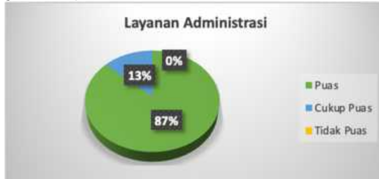
Gambar 8. Respon Peserta atas Layanan Administrasi

takmir masjid) melalui laporan keuangan yang telah disusun menyampikan pertanggungjawaban atas penerimaan dan penggunaan (pengelolaan) dana yang diamankan kepada mereka. Selain itu, laporan keuangan dapat digunakan untuk menilai kinerja majanemen sehingga dapat dimanfaatkan sebagai pengambilan keputusan ekonomi oleh stakeholders (Yuliarti, 2019). Misalnya, suatu korporasi tertentu akan memberikan dana melalui CSR kepada entitas dengan terlebih dahulu melihat akuntabilitas laporan keuangan entitas tersebut (Qadri, 2019).