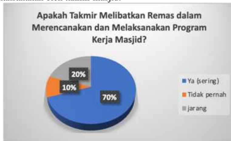
Gambar 5. Pelibatan Remaja Masjid dalam kegiatan Takmir Masjid

Pelatihan Akuntansi Masjid guna meningkatkan literasi pengelolaan keuangan masjid ini dilaksanakan dengan memanfaatkan aplikasi Akuntansi Masjid berbasis Excel, oleh karena itu peserta pelatihan harus memiliki keterampilan menggunakan aplikasi excel agar tidak mengalami kesulitan dalam mengikuti kegiatan ini. Mengingat sebagian besar pengurus takmir masjid tidak memiliki keterampilan yang dipersyaratkan, maka pelatihan ini melibatkan Remaja Masjid sebagai perwakilan dari takmir masjid. Pelibatan remaja masjid dalam pelatihan ini, sebagai representasi takmir masjid menjadi logis karena remaja masjid juga dilibatkan oleh takmir masjid dalam penyusunan rencana dan pelaksanaan setiap kegiatan yang dilaksanakan oleh takmir masjid.