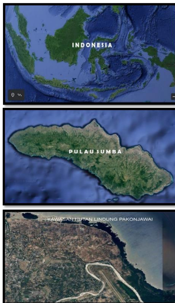
Gambar 1. Peta Lokasi Penelitian.

Jenis Penelitian ini adalah penelitian deskriptif dengan pendekatan kuantitatif, Penentuan stasiun dan plot sebagai sampel penelitian dilakukan secara purposive sampling . Waktu penelitian pada bulan Juni-Oktober tahun 2022. Populasi dalam penelitian ini adalah seluruh vegetasi mangrove yang terdapat di Kawasan Hutan Lindung Pakonjawai, Kecamatan Kampera, Kabupaten Sumba Timur. Sampel dalam penelitian ini adalah semua jenis mangrove yang terdapat di dalam plot pada setiap stasiun pengamatan. Teknik dan instrument pengambilan data dalam penelitian ini terdiri dari observasi, kuesioner, dan dokumentasi. Peta lokasi penelitian seperti terlihat pada Gambar 1.