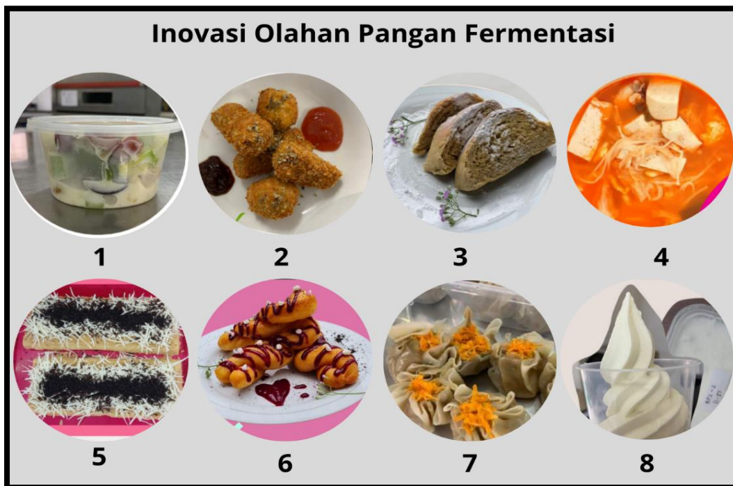
Gambar 1. Hasil Inovasi Olahan Pangan Terfermentasi oleh Mahasiswa. 1) Salad Yoghurt Kayu Manis; 2) Nugget Kacang Tunggak; 3) Roti Jahe Merah; 4) Sundubu Jjigae dari Kimchi Lobak; 5) Bolu Tape Ketan Kulit Buah Naga; 6) Donat Kepang Glaze Buah Naga; 7) Dimsum Tempe Kacang Bogor; dan 8) Frozen Yoghurt Jagung Manis-Kacang Hijau.

Berdasarkan hasil uji organoleptik, bolu kukus berbahan tape ketan kulit buah naga sangat disukai (skor 7,50). Bolu kukus tape ketan kulit buah naga ( bokuga ) merupakan bolu kukus dengan penambahan tape ketan kulit buah naga yang disajikan dengan topping coklat dan keju. Tape ketan kulit buah naga merupakan ketan yang dibuat dengan penambahan sari kulit buah naga lalu difermentasi dengan ragi. Selain itu, panelis juga sangat menyukai roti jahe merah. Roti jahe merah merupakan roti berbahan dasar tepung terigu, gula, ragi, susu, dan bahan lainnya. Penggunaan tepung terigu dikombinasikan dengan tepung jahe merah agar dihasilkan roti dengan aroma yang khas jahe, serta dapat meningkatkan nilai tambah roti. Jahe merah mengandung gingerol yang telah dilaporkan memiliki efek antiinflamasi, antivirus, antitumor, antioksidan, dan antiemetic (Promdam & Panichayupakaranant, 2022).