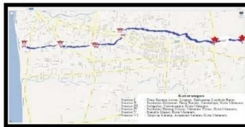
Gambar 1. Peta Lokasi Penelitian.

Teknik pengumpulan data untuk penelitian ini dilakukan dengan dua cara yaitu pengumpulan data sekunder dengan mengambil data pada instansi terkait seperti badan wilayah Sungai Provinsi Nusa Tenggara Barat, sedangkan untuk data primer diambil dengan survey inventarisasi di lapangan dan analisis di laboratorium.